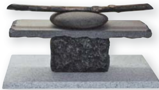
彫刻 国島 征二