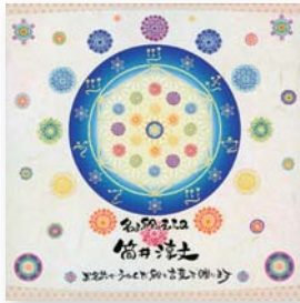
名ま絵のえふみ 筒井 淳文