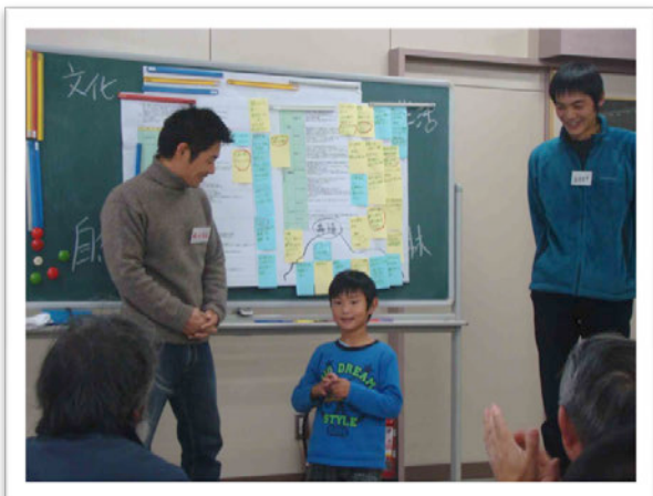
今回も『最若手』メンバー大かつやくです！

次回が最終回です。目指したい未来の共有をして、そのために住んでいる人も外から来ている人もそれぞれが役割をもって素敵なまちとなる一歩をさらに踏み出せるといいなあと思います。ぜひともご参加下さい。