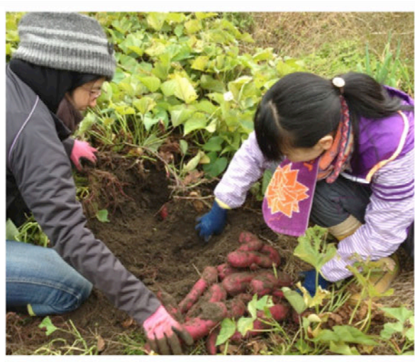
さつまいも大豊作★大きく育ってくれました。

今回は、畑作業のことをつづけていこうと思います。 2010年度、ハピ園での大豆栽培からはじまったベジ作業。