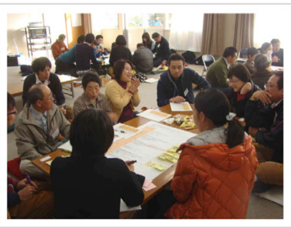
今回から参加の方も何人もいらっしゃいました。

動き出しているとの情報提供があり、森林資源の生かし方について活発な意見交換が行われました。鳥獣対策として県内他の地域よりも鹿が多いので逆に地域資源とできないかという意見も出ました。