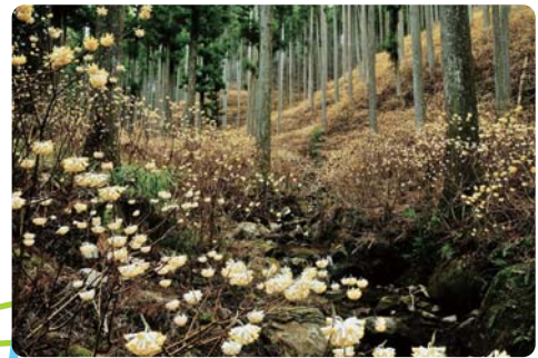
黄金色に輝くミツマタ群生地 ミツマタ開花見頃3月中旬～4月中旬