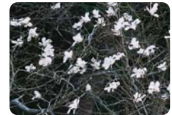
タムシバ (モクレン科)

せせらぎロード(農道) ミツマタ群生地へのウォーキングコース 乙川のせせらぎの音に耳を傾けて、春の風と山桜やタムシバの花を眺めながら歩くウォーキングは快適です。