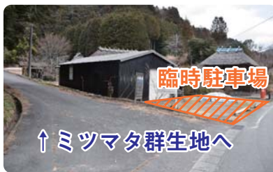
↑ ミツマタ群生地へ