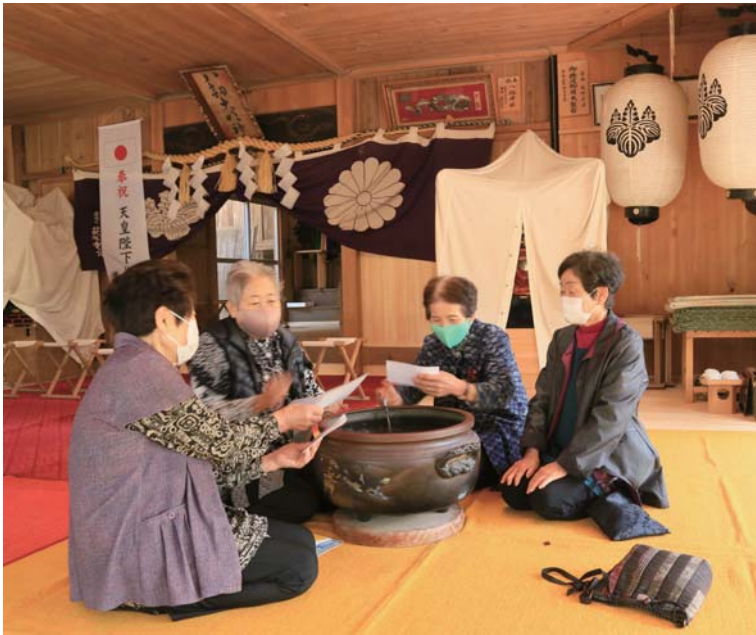
「祭りの日」（第12回最優秀賞・岡崎市長賞作品）