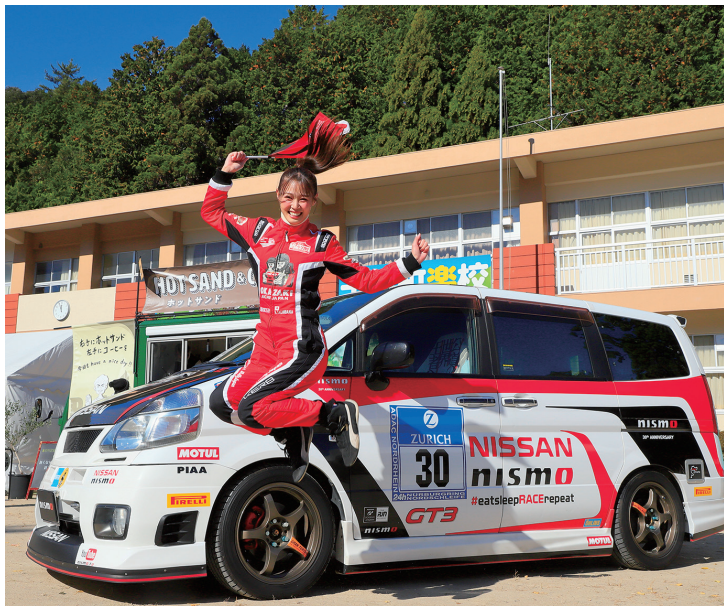
「若さでジャンプ」（第15回最優秀賞・岡崎市長賞作品）