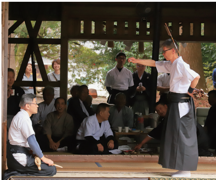
「伝統の弓儀式」（第16回最優秀賞・岡崎市長賞作品）